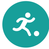
Spel en beweging / bewegingsonderwijs